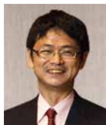
がん・感染症センター都立駒込病院 外科 医長