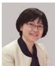
東邦大学看護学部 がん看護学研究室 教授